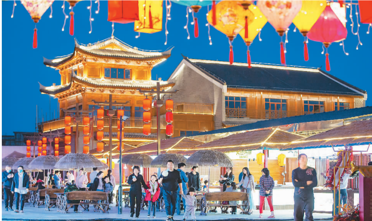
湖北省襄阳市的关圣古镇夜景流光溢彩，吸引了众多市民和游客游玩。

如今，旅游场景越来越丰富，除了名山大川、名胜古迹、主题乐园和A级景区之外，多种文化休闲、娱乐体验、酒店民宿等场所，都变身成为旅游活动的新场景，休闲生活化的旅游场景不断激发出旺盛的消费潜力。