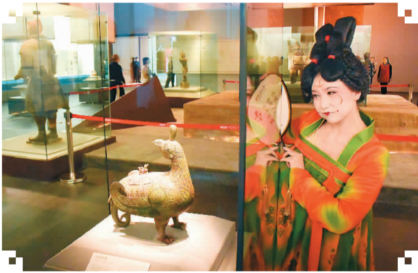
游客参观荆州博物馆的文物精品展。