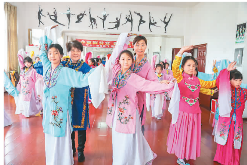
5月13日，江西省抚州市广昌县第二小学学生正在老师的辅导下学习国家级非物质文化遗产广昌盂戏表演技巧。

法国驻华大使馆文化专员白莫迪说：“这个激动人心的策划体现了法国音乐的精妙、热情与精湛的技艺。系列音乐会将成为第15届‘中法文化之春艺术节’古典音乐板块最令人瞩目的篇章。”