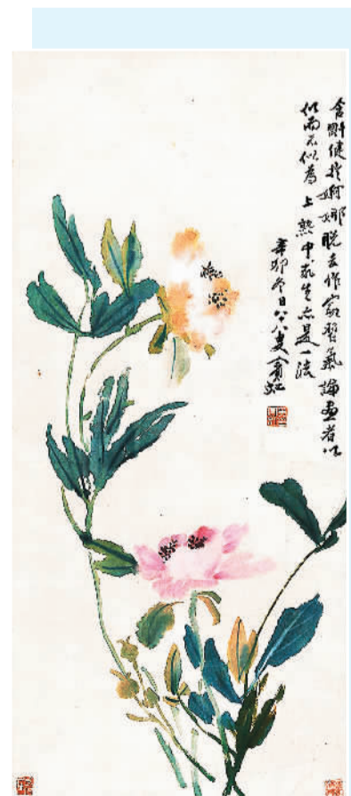
▲ 芍药（中国画） 黄宾虹 ▲ 翠鸟大虾（中国画） 齐白石