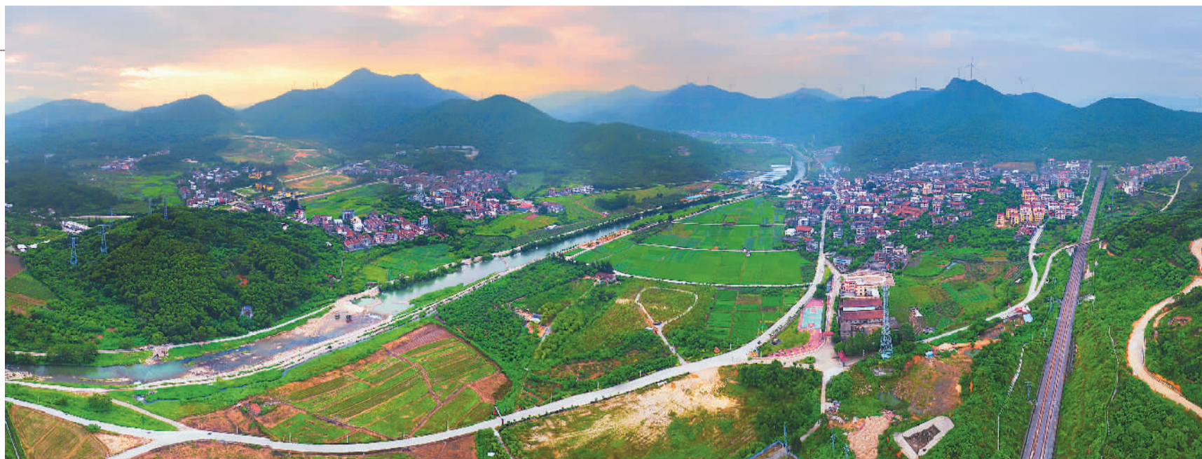
图为东大村蒜溪流域。