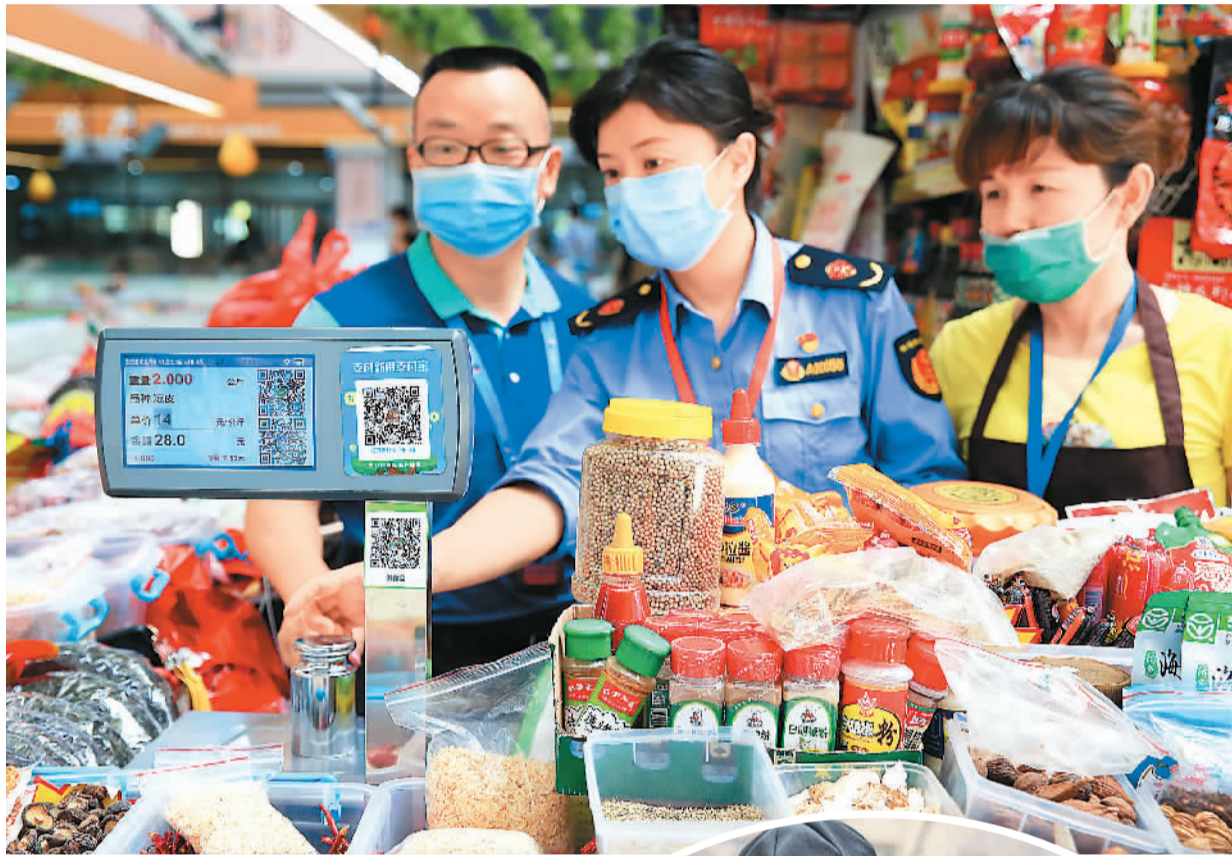
▲江西省南昌市市场监督管理局执法人员在红谷滩沁园农贸市场使用2KG重的砝码对市场内的电子秤进行检测。