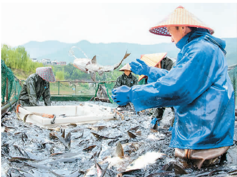
▲近日，湖北省襄阳市保康县寺坪镇南河渔业农民专业合作社渔民将鱼装箱外销。

据悉，多年来，海洋伏休渔汛期只有海蜇单一品种实行专项捕捞。随着中国海洋伏休渔制度逐步完善和渔业管理能力提升，农业农村部开始逐步扩大专项捕捞范围，先后将丁香鱼、毛虾、口虾蛄等新增为专项捕捞品种，以更好地促进渔业资源保护与合理利用。