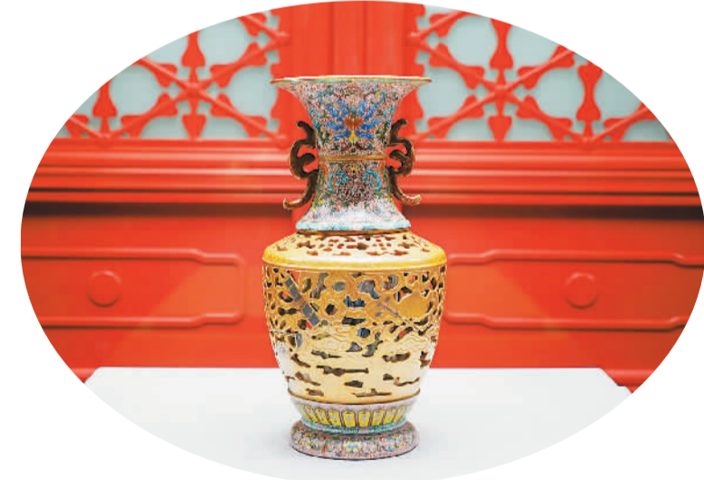
清乾隆粉彩镂空暗八仙纹双耳转心瓶

陶瓷馆每一件展品的说明牌上都有二维码，观众扫一扫就进入“故宫陶瓷馆”小程序，可以看到文物的详细信息，还能为喜爱的文物“点赞”，放进“收藏夹”，在“笔记”中记下自己的心得，分享给朋友。展厅里还设有几块互动触摸屏，以数字化方式呈现20件馆藏精品，通过触屏操作可以任意放大、缩小、翻转，把精美瓷器“捧在手中”仔细欣赏。