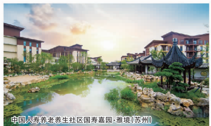
中国人寿养老社区国寿嘉园·雅境(苏州)

2019年，重庆市开展长期护理保险制度试点，中国人寿承保了当地20万城镇职工长期护理保险，目前已为601名重度失能人员办理护理服务，累计发放护理补助金近630万元。通过失能评定的人员，可以向重庆长期护理保险巴南服务中心提交申请，自主选择协议护理机构后，就能享受上门护理服务。在全国范围内，中国人寿长期护理保险承保人数超1550万人，为失能人员的基本生活和医疗护理等提供服务和资金保障。