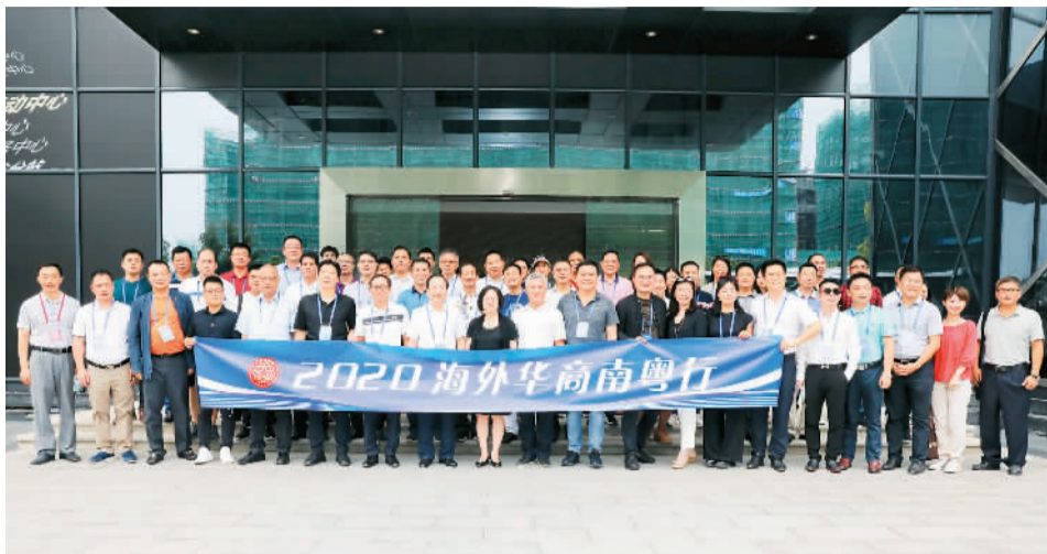
图为二〇二〇年广东省侨联等单位组织的海外华商南粤行活动合影。