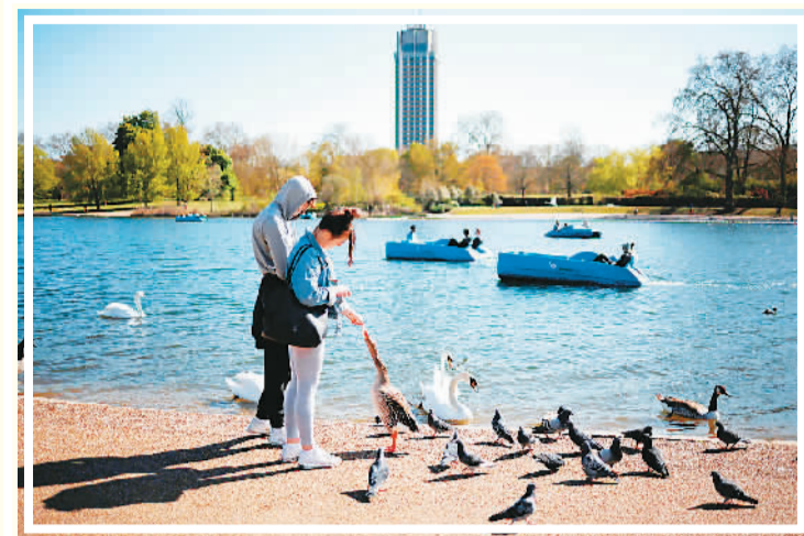
4月23日，人们在美国伦敦海德公园休闲。

来英国读书之前，我对这里的印象是符号化的：火车、电话亭、披头士、莎士比亚……甚至是007和哈利波特。我会想象自己在不列颠岛的生活，再一步步地规划自己的留学生活。