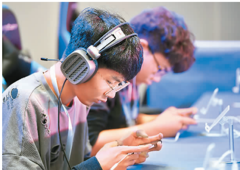
▲移动互联网的发展，对网吧产生了严重冲击。图为日前在陕西西安举办的“我要上全运”电子竞技公开赛上，来自西京学院的电竞队员正在进行《和平精英》表演赛。