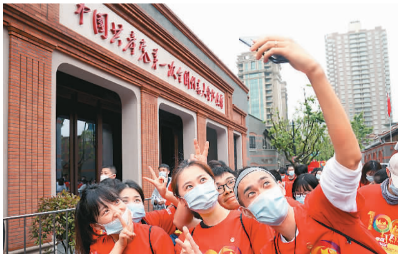
5月4日，在上海中共一大纪念馆国旗广场，参加“五四”主题集会的青年们在自拍合影。