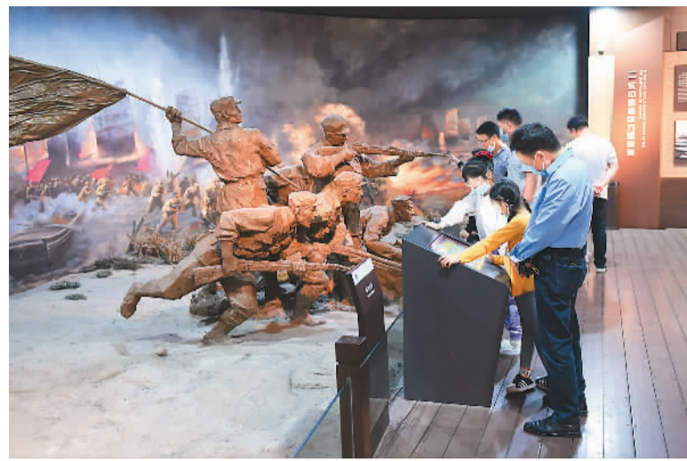
5月3日，游客在安徽合肥的渡江战役纪念馆参观。