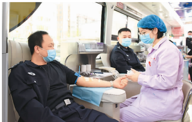
近日，辽宁省丹东港出入境边防检查站组织党员民警开展学党史、报党恩义务献血活动，以实际行动践行党史学习教育成效。

平台实时直播全省高速路网的重点易拥堵路段，包括成渝、成雅等10条高速公路20处视频监控点位，车主可以通过手机及时了解全省的路况情况。浙江交通部门推出了“浙里畅行”，实时查看“高速公路”，尤其可查看部分重点高速公路的实时监控视频，进行路径规划。此外，还能查看宁波、舟山、丽水的城市公交；杭州、宁波的城市地铁；宁波的水上巴士和公共单车；舟山综合换乘、舟山交通动态、丽水停车场分布情况等出行信息。