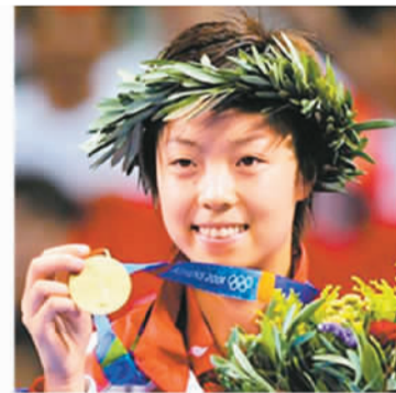
从先农坛体校走出的世界冠军们。