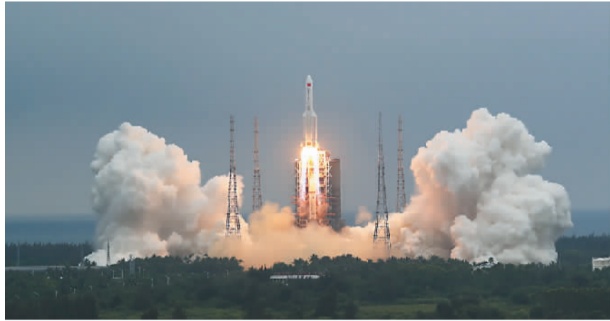
4月29日11时23分,中国空间站天和核心舱在海南文昌航天发射场发射升空,准确进入预定轨道,任务取得成功。