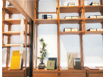
颐和园书苑·霁清轩