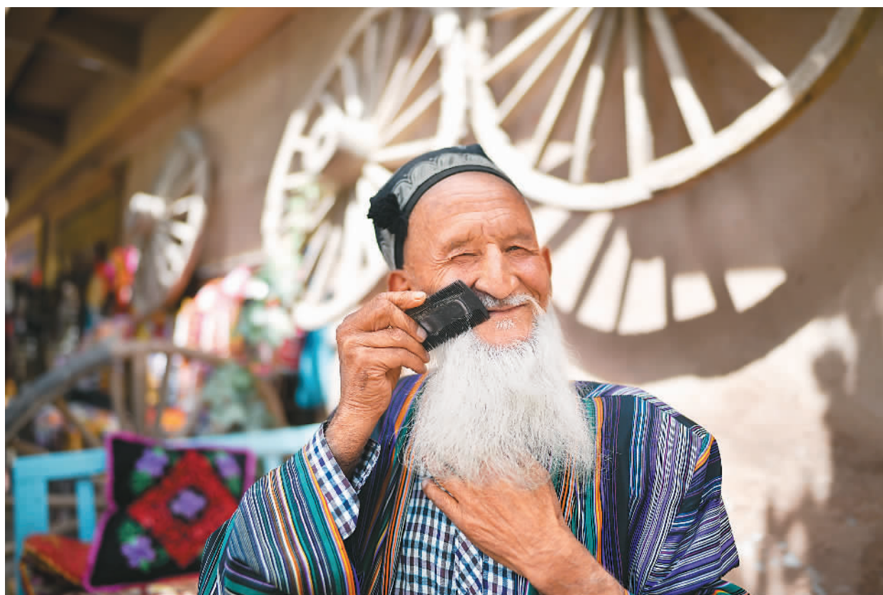
在惬意地享受午后时光。如今的疆,各民族亲如一家,人民安居乐业。图为维吾尔族老人。