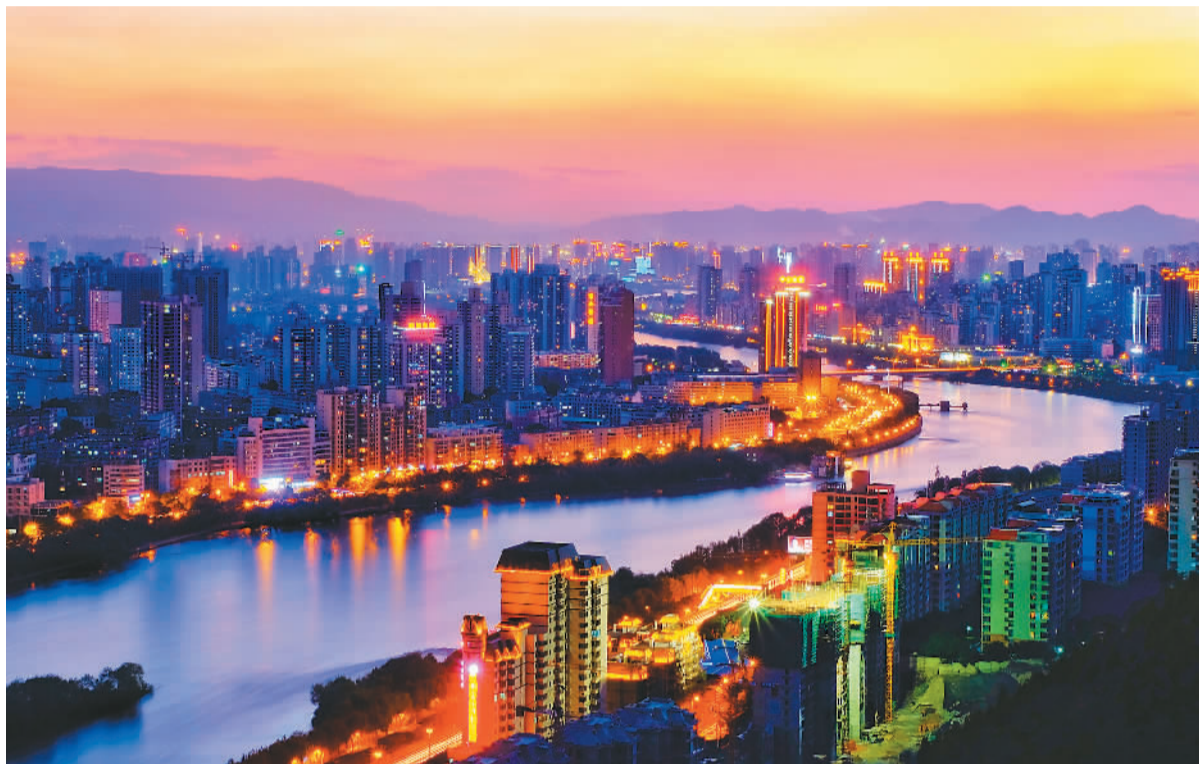
黄河“怀抱”中的兰州。