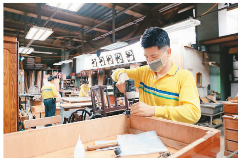
台北市环保局木工厂内,师傅正在耐心修复废旧木柜组件。

每逢台风或台风后,台东县的溪床、海边便有不少漂流木,如何处理这些木材一直困扰着当地环保部门和林务部门。