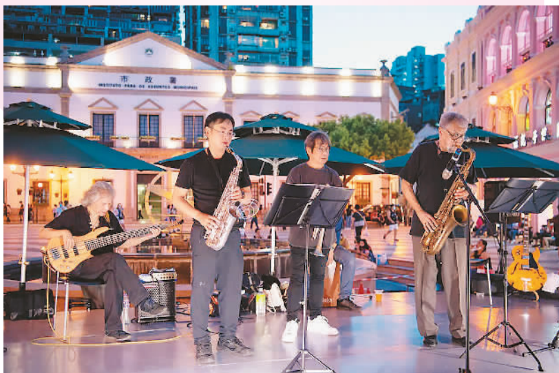
充满欧洲风情的舞台音乐表演。