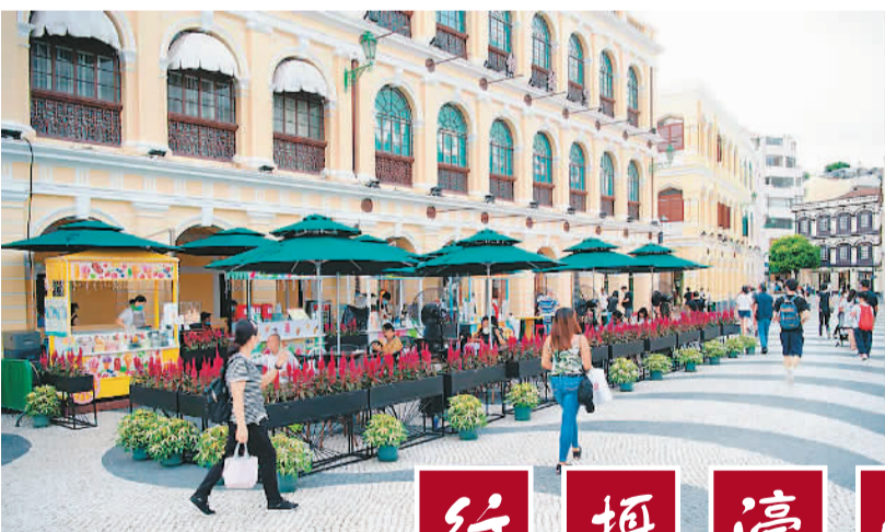
议事亭前地的露天茶座。

上图:历届香港体育节上,参与者在乒乓球、跳远、举重、帆船等项目奋力拼搏,力争上游。(资料图片)