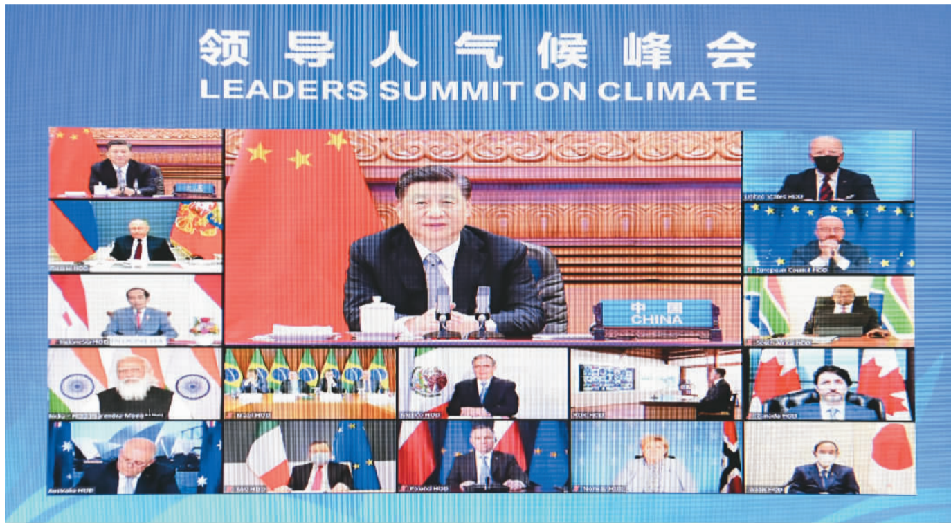
4月22日晚,应美国总统拜登邀请,国家主席习近平在北京以视频方式出席领导人气候峰会,并发表题为《共同构建人与自然生命共同体》的重要讲话。

新华社北京4月22日电 应美国总统拜登邀请,国家主席习近平22日晚在北京以视频方式出席领导人气候峰会,并发表题为《共同构建人与自然生命共同体》的重要讲话。