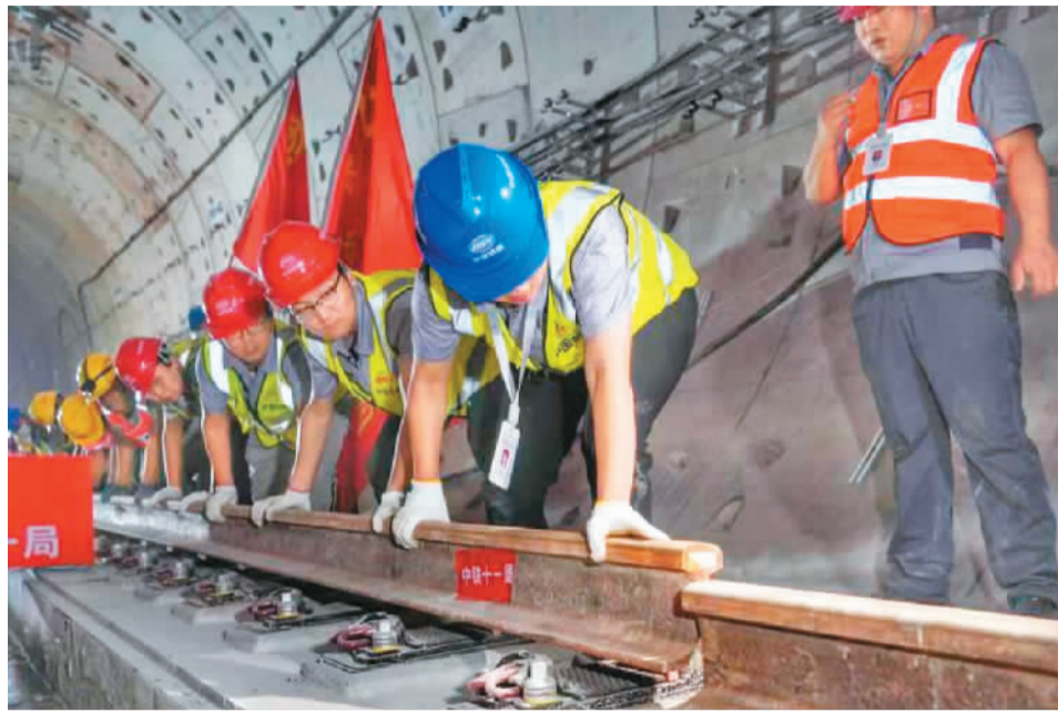
图为广州地铁18号线施工现场。