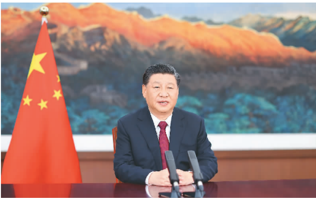
4月20日上午, 博鳌亚洲论坛2021年年会开幕式在海南博鳌举行, 国家主席习近平以视频方式发表题为《同舟共济克时艰, 命运与共创未来》的主旨演讲。

倡议亚洲和世界各国回应时代呼唤, 携手共克疫情, 加强全球治理, 高质量共建“一带一路”, 朝着构建人类命运共同体方向不断迈进