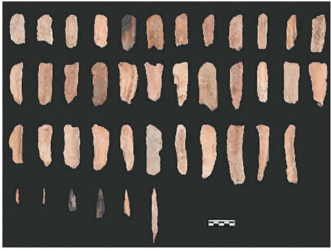
上图：招果洞遗址文化堆积分为四期6个阶段，从第一期晚段开始，加工精美的磨制骨角器大量出现，加工原料主要是动物的骨骼和鹿的角。这些磨制骨器揭示了中国南方旧石器时代晚期的技术更新。 图为招果洞遗址部分出土磨制骨角器。