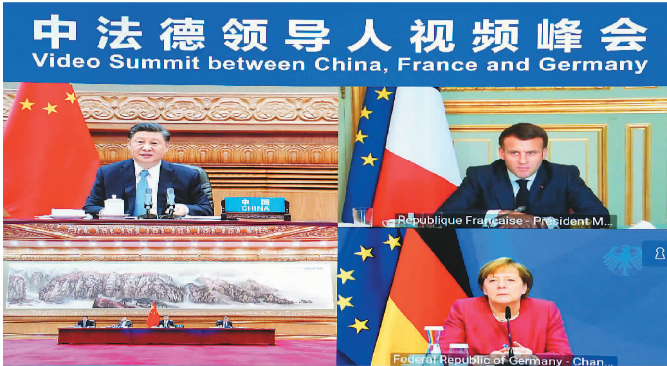
4月16日下午,国家主席习近平在北京同法国总统马克龙、德国总理默克尔举行中法德领导人视频峰会。

新华社北京4月16日电 4月16日下午,国家主席习近平在北京同法国总统马克龙、德国总理默克尔举行中法德领导人视频峰会。三国领导人就合作应对气候变化、中欧关系、抗疫合作以及重大国际和地区问题深入交换意见。