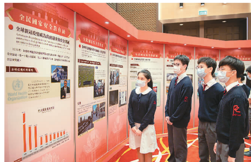
4月15日，澳门学生在“全民国家安全教育展”上参观。

开幕仪式由全国政协副主席何厚铨、澳门特区行政长官贺一诚、澳门中联办主任傅自应、外交部驻澳门特派员公署特派员刘显法、解放军驻澳门部队司令员徐良才主持。出席开幕