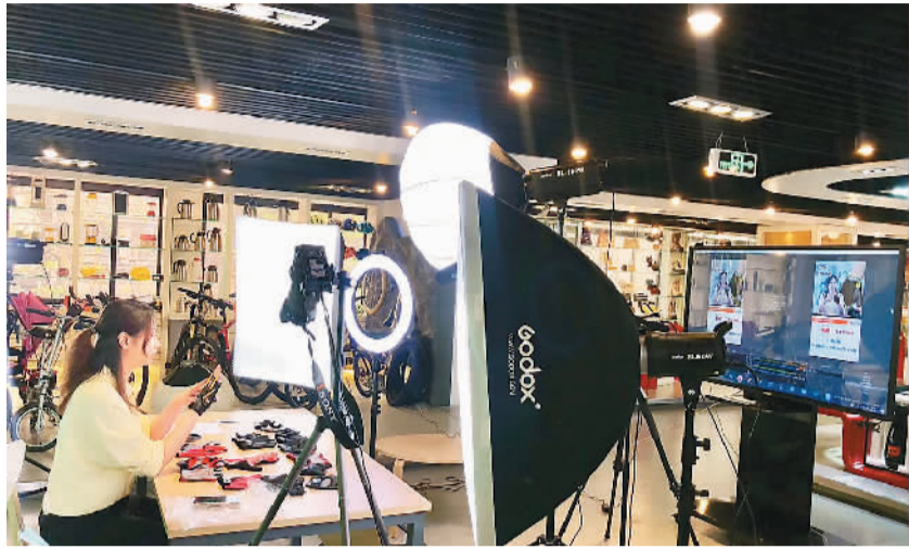
四月十五日，广州轻出集团股份有限公司工作人员在广交会上直播推介公司产品。