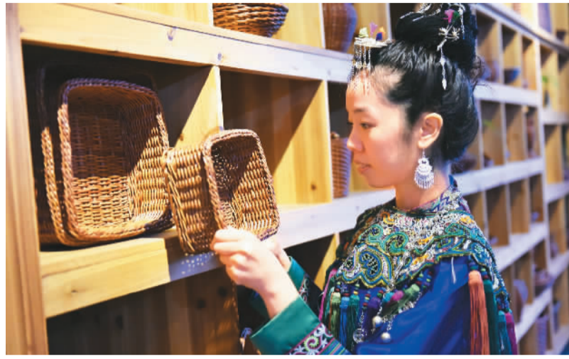
在第一百二十九届广交会上，来自贵州省榕江县的一家企业营销人员展示参展的藤编产品。

4月15日，第129届广交会在“云”端开幕，会期十天。据了解，本届广交会按照电子家电、机械、建材、日用消费品、家居装饰品、纺织服装等16大类商品设置50个展区，展位总数约6万个，境内外参展企业近2.6万家。参展企业通过图文、视频、3D、VR等多种形式展示，为全球采购商呈现一场经贸合作的盛宴。