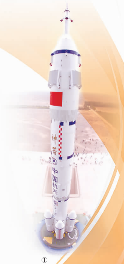
图①：2008年9月20日，神舟七号飞船箭塔组合体从技术区垂直转运至发射区。