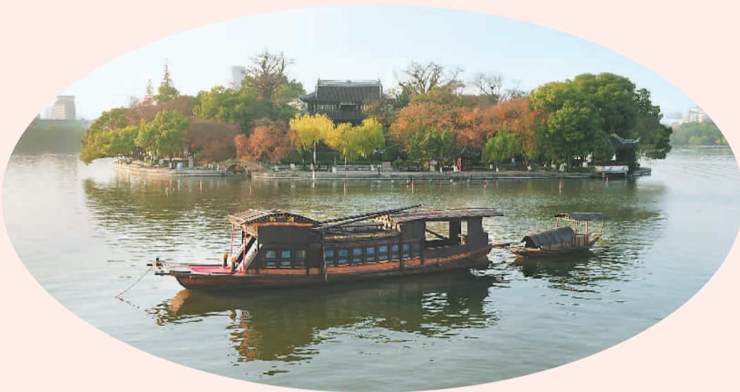
嘉兴南湖中共一大纪念船