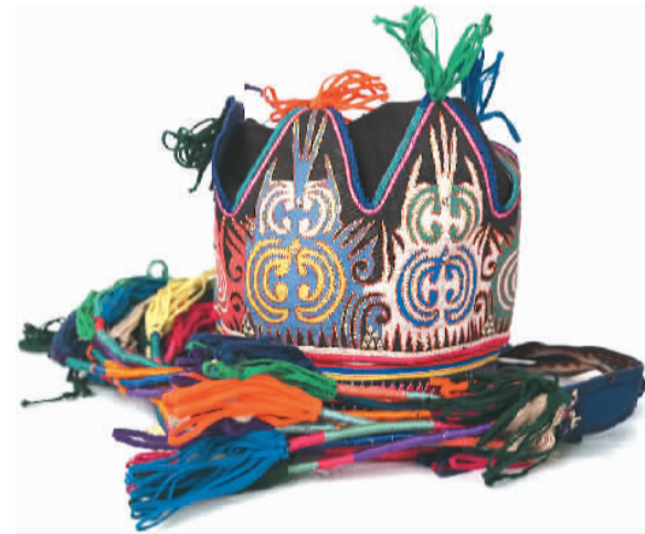
哈尼族“吴芭”帽