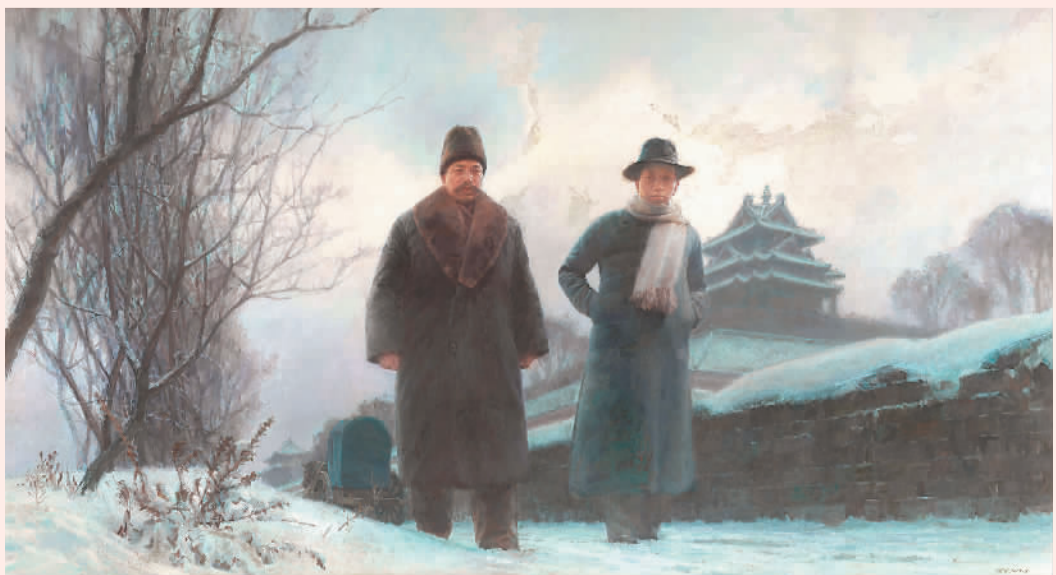
陈坚油画作品《南陈北李 相约建党》

这是一艘中型的单夹弄丝网船，全长约16米，最宽处有3米。船头平阔，船身分前舱、中舱、后舱和后舱，以左边的一条通道贯通。中共一大就在原船的中舱举行。后舱跟中舱隔着一个房舱，以保证隐蔽。船舱用榉木、楮木等硬木材料制成，舱底用框状木板铺平。船后有一小拖梢船，过去为船家进城购物、接送客人之用。