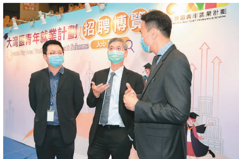
香港举办“大湾区青年就业计划招聘博览”，鼓励年轻人到大湾区内地城市发展。

展望未来，特区政府将成立“大湾区香港青年创新创业基地联盟”，邀请粤港两地机构加入，携手建立一站式信息、宣传及交流平台，进一步支持在大湾区创业的香港青年。