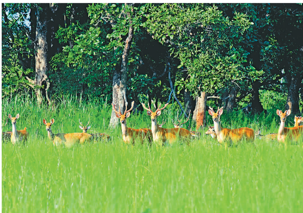
奇特旺国家公园被列为世界自然遗产。图为公园里的鹿群。

采访结束当天，栏目组以“尼泊尔最牛特产是什么”驻华大使亲自揭秘”为题发布短视频，有眼尖的网友认出了尼泊尔“孔雀窗”。尼泊尔驻华大使馆工作人员也在社交媒体上回应：“欢迎大家在疫情结束后前往尼泊尔。”