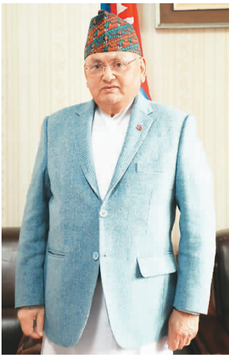
尼泊尔驻华大使马亨德拉·巴哈杜尔·潘迪近照。