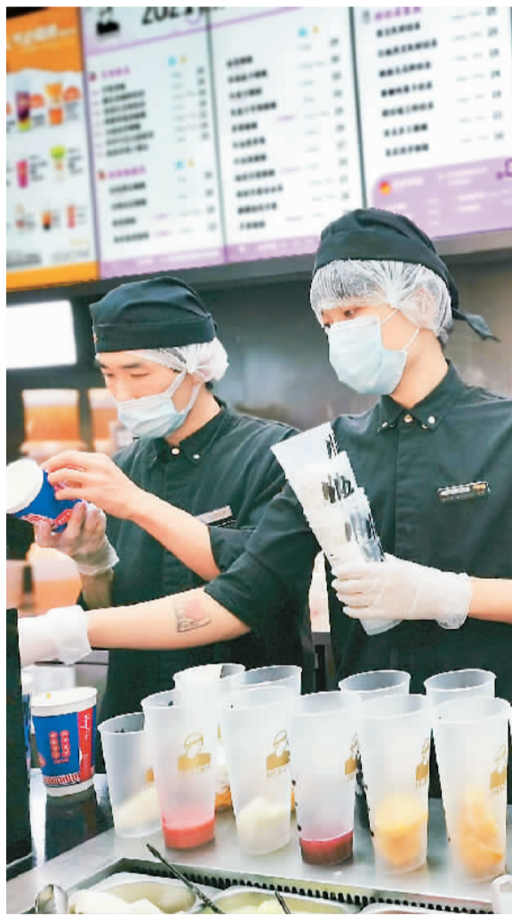
4月6日，在北京市朝阳区合生汇的一家奶茶店，调饮师在为顾客准备奶茶。