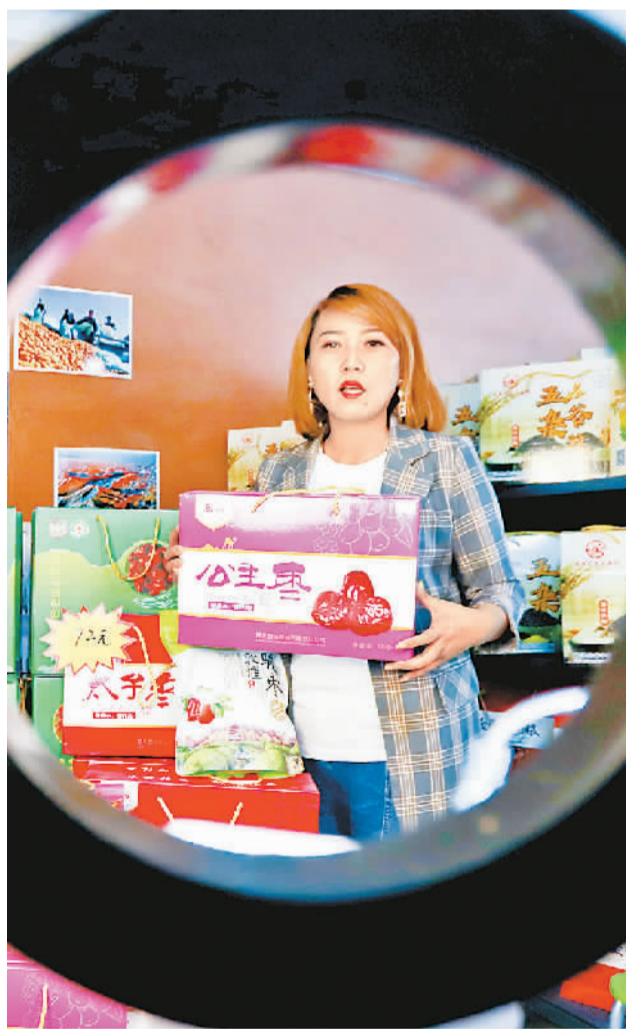
一名直播销售员在金张掖文旅农特产馆直播间为临沂红枣带货。

“要脚踏实地，深入生活，投身职场活动，同时观察自己的能力，找到两者紧密结合的发展方向，应对不断变化的市场。”陈宇说。