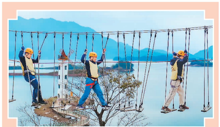
游客在浙江淳安千岛湖啤酒小镇驴营地探险乐园进行高空探险体验。

上海体育学院副教授林章林认为，中国体育旅游将迎来多个增长点：以“小聚集、大空间”为主要特点的露营休闲度假游将成为体育旅游消费新热点。红色体育旅游迎来新的市场爆发期，以红色徒步为代表的红色体育旅游将是游客参与红色体育旅游的重要形式。以青少年体育运动为主的家庭旅游消费将成为热潮，各项运动夏令营、游学等活动带动了家庭在运动休闲方面的消费。体育运动休闲特色小镇成为体育旅游发展的重要载体，冰雪体育旅游将成为全民新时尚，北方利用地理气候资源优势，大力打造冰雪体育旅游线路，南方和中心城市利用科技优势，打造室内外冰雪体育旅游产品。