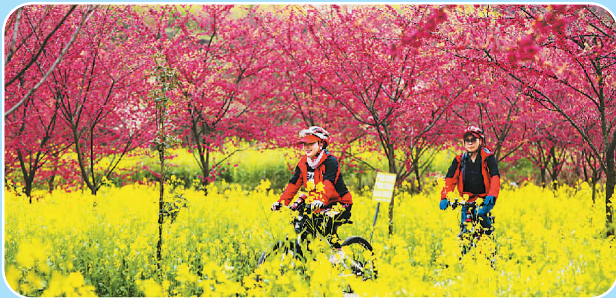
骑行爱好者在贵州省毕节市黔西县林泉镇中国红樱花基地骑行赏花。