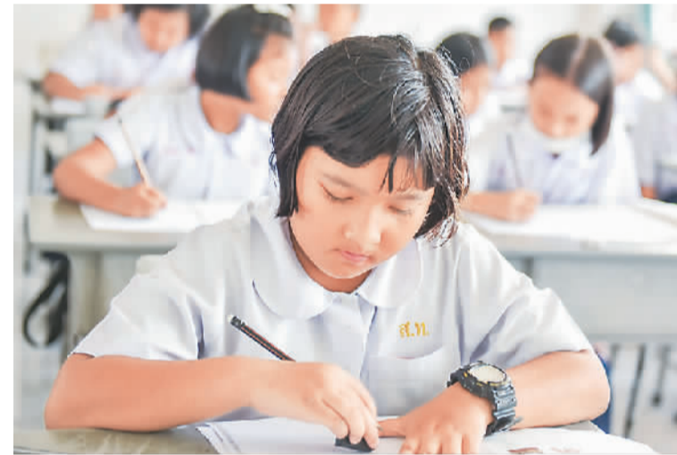
▲二〇一九年十月一日，泰国宋卡王大学普吉分校成功举办“少儿汉语考试（YCT）”，考生总计一千九百七十八名。