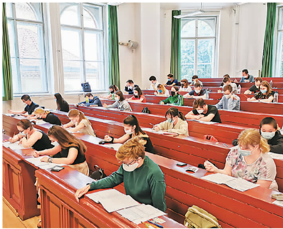
▲2020年7月12日，匈牙利罗兰大学按当地疫情要求顺利组织实施“汉语水平考试（HSK）”，263人参加。