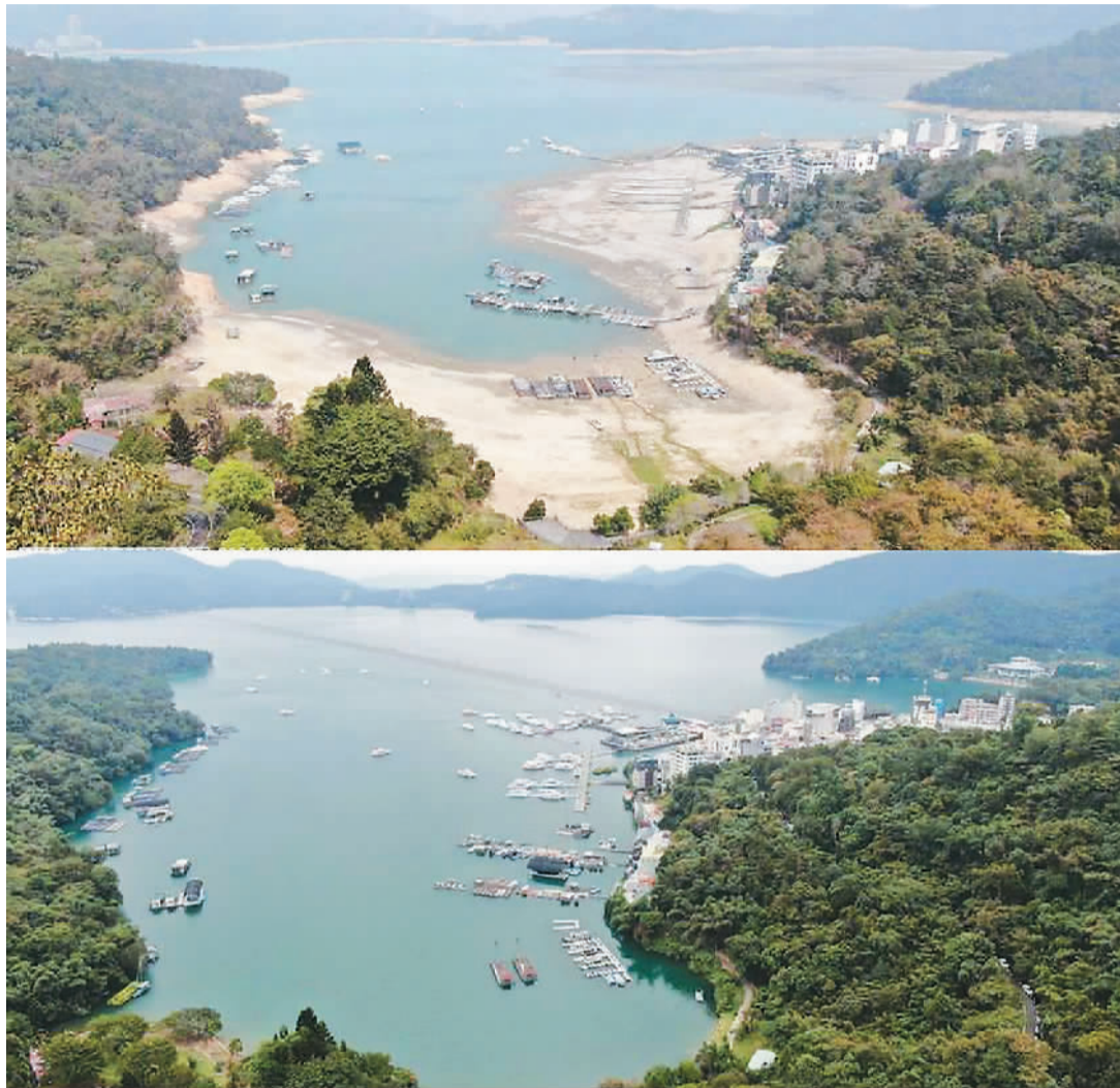
图为今年三月（上）与去年九月（下）日月潭水域范围的对比图。

台湾《中国时报》发表社评指出，关于缺水问题，气象专家早在去年冬天就已发出警告。但民进党当局却怠于超前部署，规模庞大的“前瞻计划”也不思通盘解决水源供应不足问题，弄得大家都“看天吃饭”。这只能说是政客和官僚们怠惰、无能，枉费台湾年降雨量2500毫米、为全球平均值900毫米2.8倍的优越条件。结果反而“活像个乞丐拿着金饭碗向人乞讨，令人扼腕感叹”。