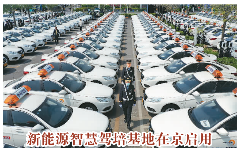
4月8日，北京东方时尚新能源智慧驾培园区正式启用。作为全国驾培行业转型升级的重要之举，该园区共投入新能源智能教练车1000余辆，并安装充电桩1049个。园区投入使用后，每年将实现减少二氧化碳排放5800余吨。图为工作人员走过新能源智能教练车。

大会共设4个分站赛、13条路线，既包含绿水青山托起的“门头沟小院+”路线，也涵盖了红色抗战的人文风景，通过分站赛、月月走、线上走三种模式，为徒步爱好者呈现精彩纷呈的徒步活动。