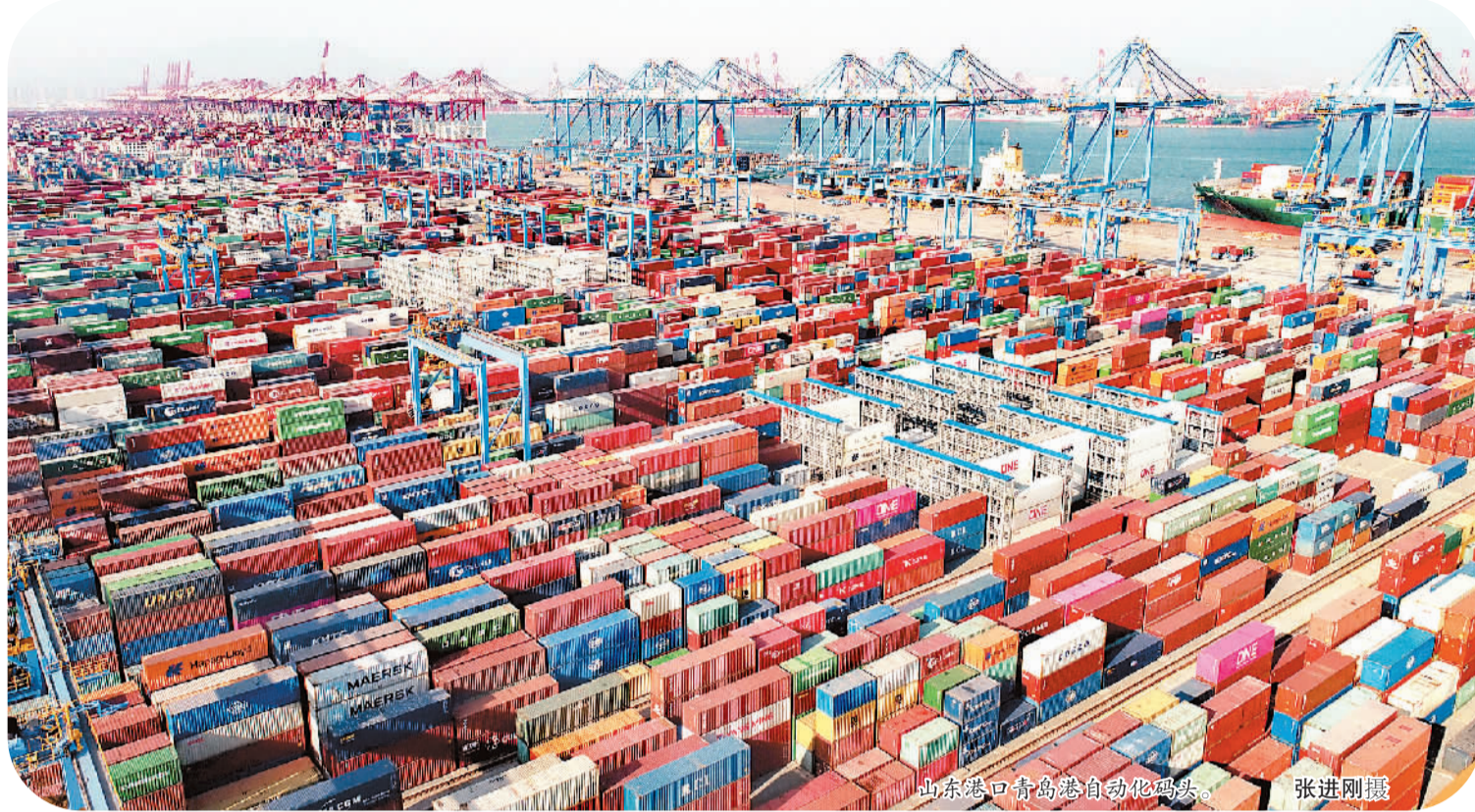
山东港口青岛港自动化码头。

今年一季度青岛港迎来“开门红”，新增“一带一路”航线4条，实现了对“海上丝绸之路”沿线国家的全覆盖，为国内外贸企业与东南亚、欧洲、地中海、中东以及非洲等