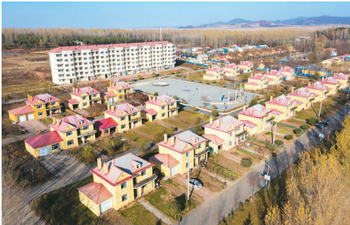
昔日的“光腚屯”,如今建起了一栋栋楼房和别墅。