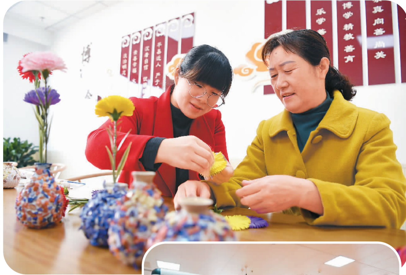
▲日前，安徽省合肥市肥西县上派镇“爱和家人”居家养老服务中心正式开放，为周边老人提供休闲娱乐、基本医疗、餐饮等服务。图为一位老人（右）在该中心学习制作手工艺品。

在董登新看来，基本养老保险扩围的主要对象有城镇下岗职工及失业人员、在城乡之间流动的农民工和没有能力缴纳社保的农民等。一方面，他们的支付能力更弱，另一方面也可能缺乏对基本养老保险福利性质的认识。扩大覆盖面是