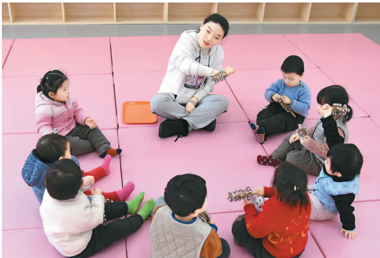
日前，江苏省连云港市设立的首批11家普惠托育试点陆续开始运营，切实减轻家庭抚育0到3岁子女的压力。图为连云港市海州区新海街道小红花托育中心的小朋友在老师指导下做游戏。

公办幼儿园入园难、民办幼儿园入园贵、0-3岁婴幼儿托育机构少……这些问题都有望在“十四五”期间得到解决。