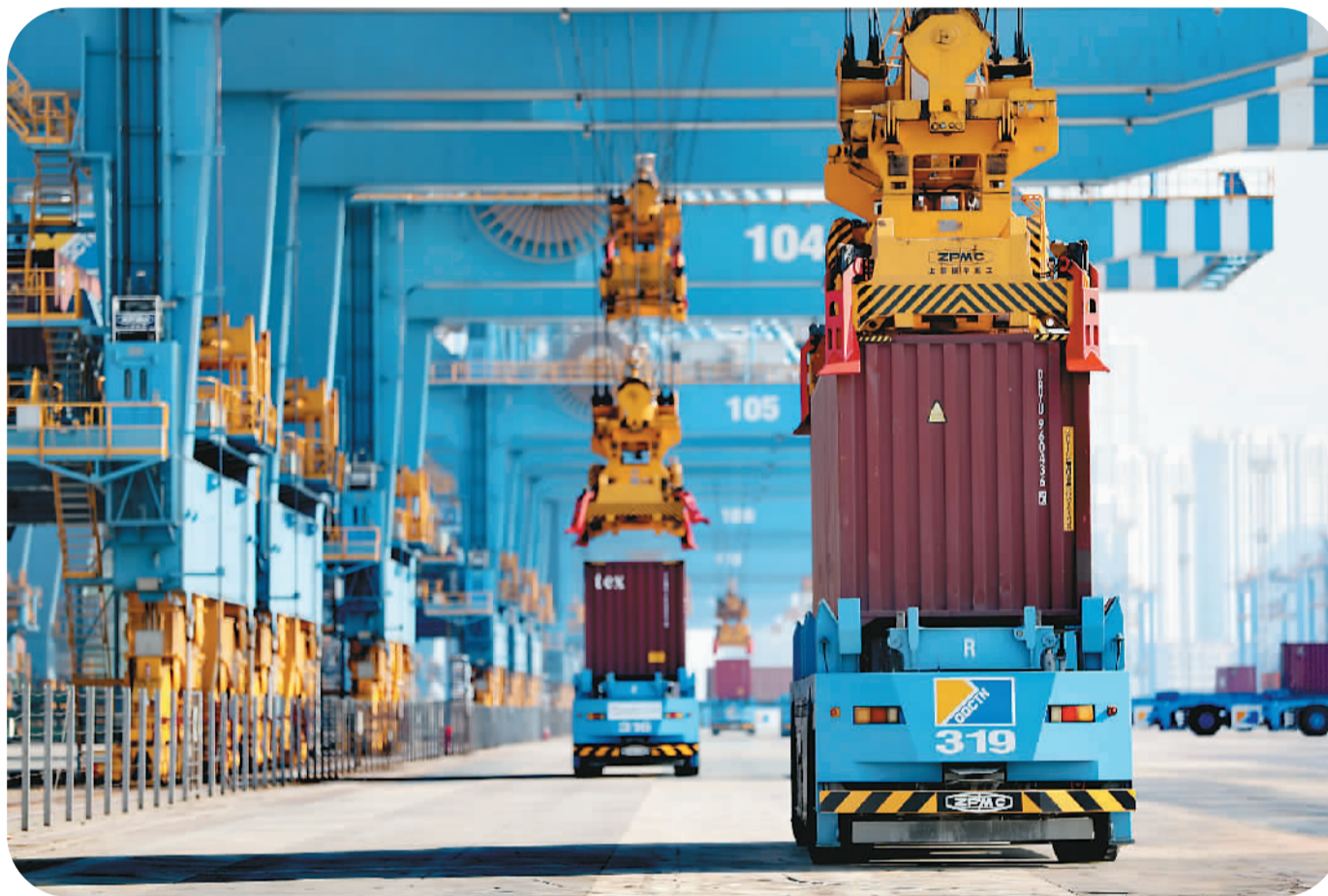
在位于山东自贸区青岛片区的山东港口青岛港全自动化码头,自动驾驶车正在忙碌地来回穿梭。

此外,中国还设有沿海重点开发开放试验区、边境经济合作区、跨境经济合作区、内陆开放型经济试验区等各类开放平台,在不同时期、不同区域各自发挥着改革开放“试验田”的先行作用。