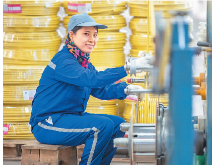
海南美亚高性能铜加工材生产基地是2021年海南自由贸易港建设项目第一批集中开工的项目,建成后预计将生产10万吨/年的高性能光亮铜杆、精密超薄铜箔、高精度铜管等产品。图为工人在海南美亚铜业集团有限公司车间加工电线电缆。