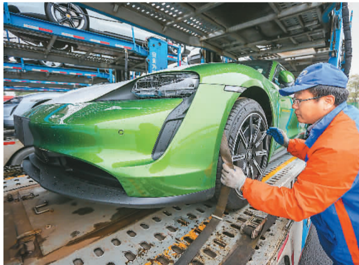
去年底,进口整车保税仓储展示功能在松江综合保税区首次落地,该保税区成为上海首家开展高端进口汽车保税展示业务的综合保税区。图为一批进口保时捷汽车日前抵达上海松江综合保税区,工作人员正在卸货。