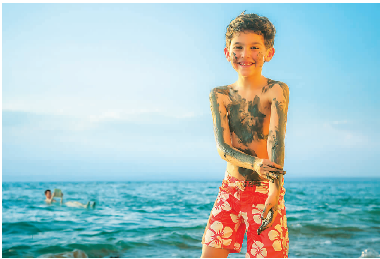
死海被称为世界上最大的天然水疗中心，每年吸引众多游客前往。图为一名儿童开心地给自己涂抹死海泥。

推动抗疫国际合作，中国一直走在前列。点滴细节之间，世界感受到了“中国温度”有多暖。