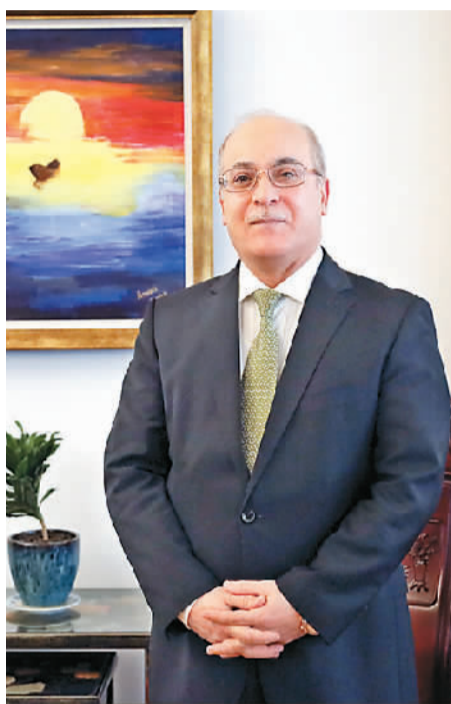
约旦驻华大使胡萨姆·侯赛尼近照。