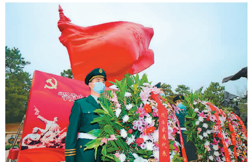
清明节到来之际，北京八宝山革命公墓举行“学党史 祭英烈 守初心 担使命”主题活动，通过一系列祭扫活动纪念和缅怀革命先辈，寄托绵绵哀思。图为工作人员在烈士纪念碑前敬献花圈。