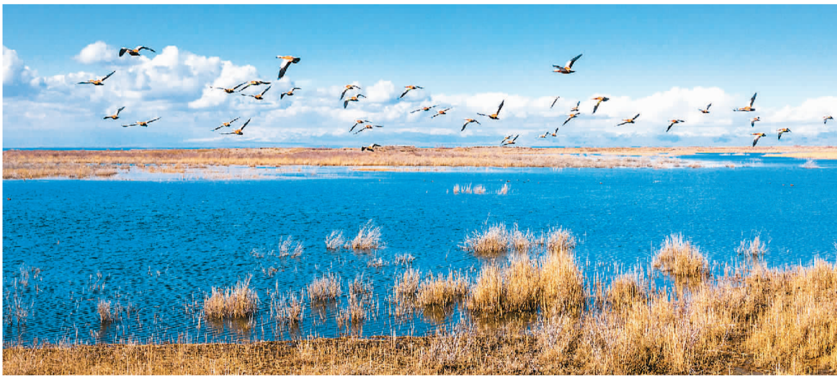
春雨过后，位于新疆维吾尔自治区巴音郭楞蒙古自治州博湖县境内的博斯腾湖，引来水鸟觅食。清澈的湖水、蓝天、白云和水鸟彰显了当地生态文明建设成效。图为一群赤麻鸭在新疆博斯腾湖南岸觅食。 年 磊摄（人民视觉）