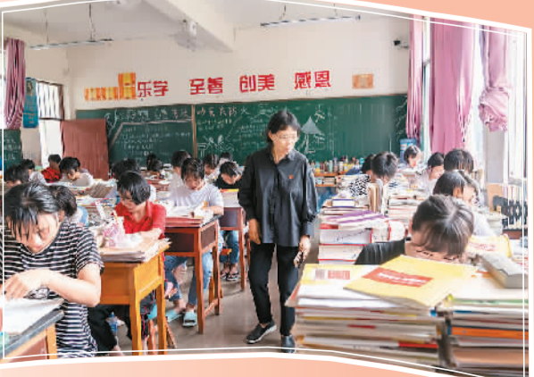
张桂梅在检查学生上课情况。