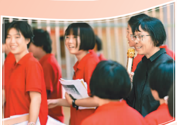
张桂梅和学生们在一起。