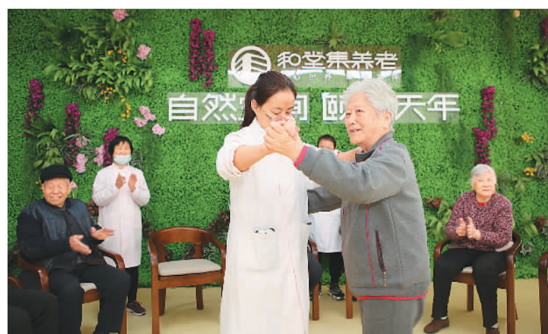
日前，山东省东营市东营区辛店街道和堂集·辛店老年公寓活动区，老人们在工作人员带领下做活动。该机构是集五保供养、社会托养、社区居家养老为一体的养老服务中心，配套建设了棋牌室、娱乐室、医务室、心理咨询室、康复训练厅、老年课堂等功能室，全方位满足老年人的健康生活和精神需求。

针对中国神经母细胞瘤患儿迫切的临床需求，2020年初，药企百济神州从海外引入新药物“达妥昔单抗”，该药能使肿瘤细胞裂解和死亡。在海南博鳌乐城国际医疗旅游先行区一系列创新政策支持下，该药提前在国内“绿色通道”落地，并成功实现了首例患儿的输注。