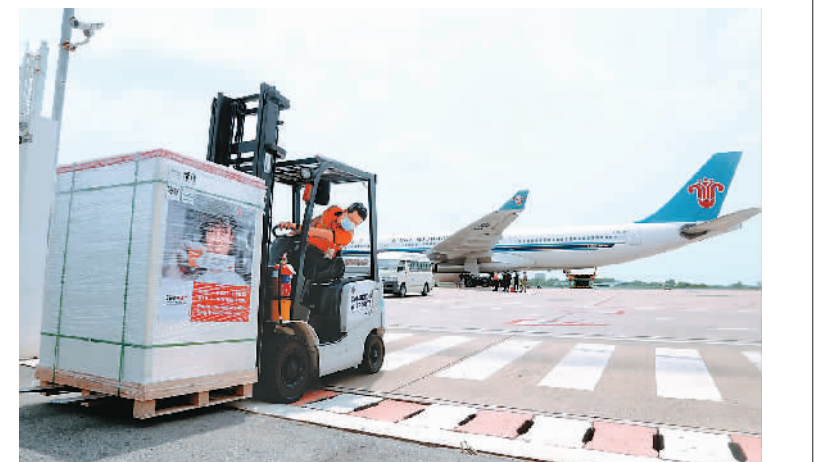
图为3月26日，柬埔寨工作人员在金边国际机场搬运刚刚抵达的中国科兴新冠疫苗。

时间向柬提供优质价廉的疫苗，极大缓解柬方燃眉之急。中国企业生产的新冠疫苗有着公认的安全性和有效性，中方还积极向众多国家和国际组织提供疫苗援助，对国际抗疫合作做出了不可替代的重要贡献。