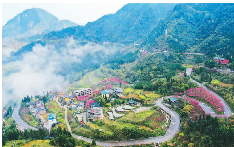
重庆市万盛经开区黑山镇南门乡村公路两侧，桃花盛开，晨雾、梯田、农家，宛如人间仙境。

每座城市都有一条“改变历史”的公路。300多处文化景点犹如珍珠一般，被一条乡村路串成一串，吸引无数游客前来观光。这是河北涉县的千里乡村路。因为这条路的串联，当地打通了旅游发展“大动脉”，红色