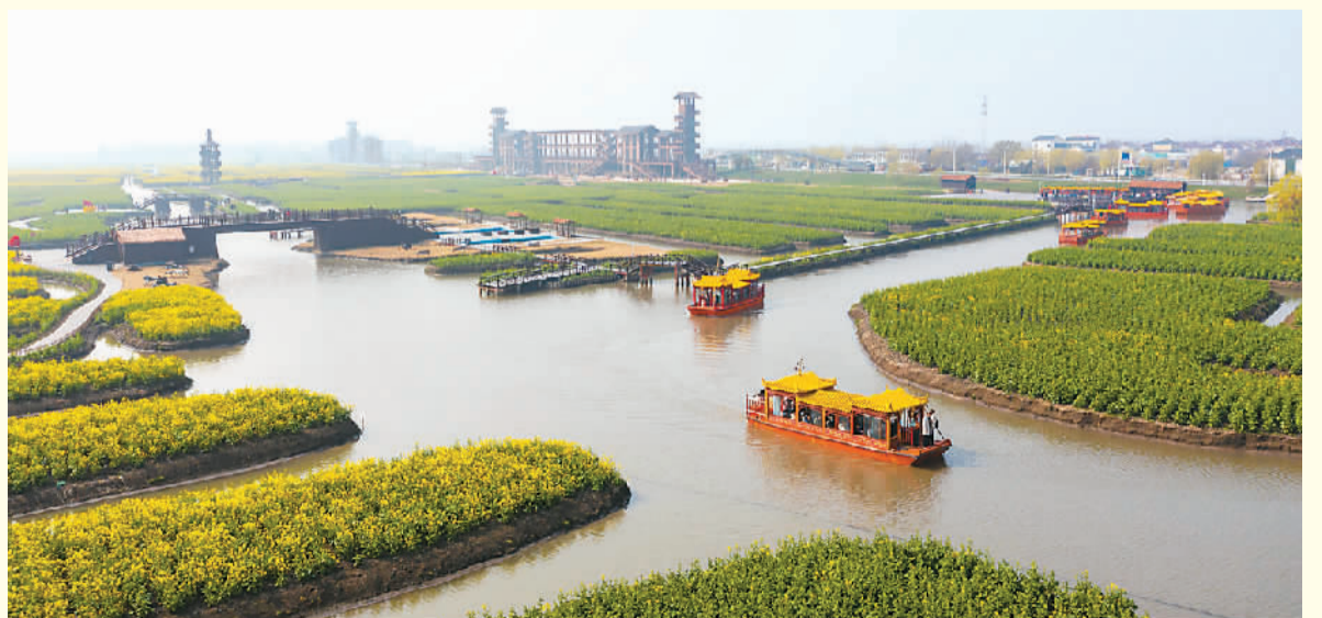
兴化垛田即将进入一年一度的最美农业景观季。(摄于3月14日)

垛田遗产地历史悠久。这里人文古朴,物产丰饶,贤杰辈出。到兴化观光旅游,不只是观赏油菜花,同时也是穿越历史,领略中华文化的博大精深。兴化是战国楚将昭阳的食邑,《水浒传》作者施耐庵、明代“嘉靖七子”的宗臣、清代“扬州八怪”的郑板桥,以及被称为“东方黑格尔”的近代硕儒刘熙载等历史文化名人的故里。漫步在兴化古巷的石道上,伫立于星布古城的陈列馆文化馆,让人顿悟,悠悠千古事,恍如一瞬间。