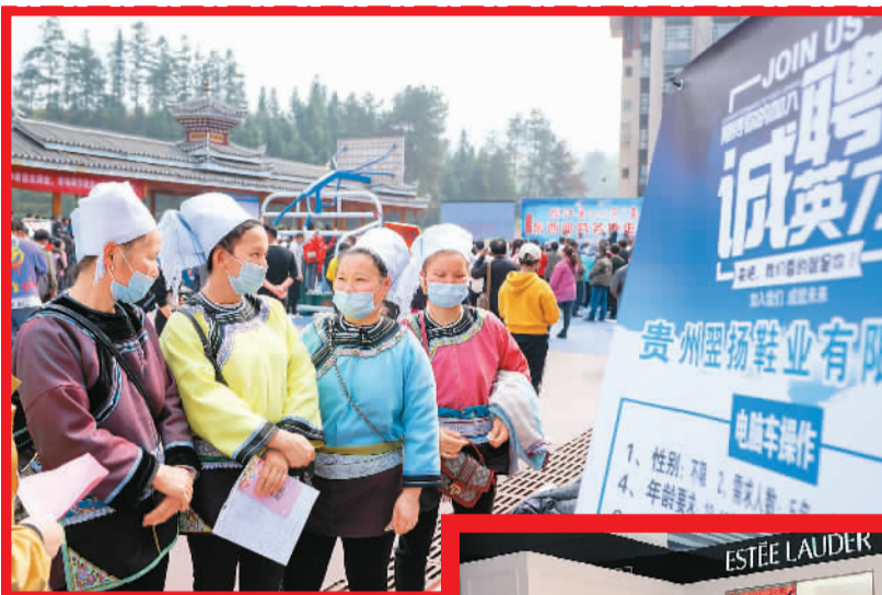
3月17日，贵州省榕江县2021年春风行动暨东西部劳务协作招聘会举行。图为求职者在应聘。