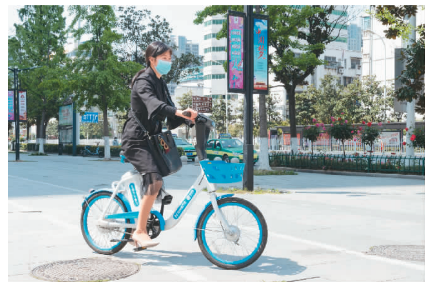
在湖北省襄阳市樊城区，市民正在骑共享电动助力车出行。