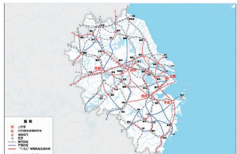
图 6 长三角地区轨道交通规划图

瞄准国际先进科创能力和产业体系，加快建设长三角 G60 科创走廊和沿沪宁产业创新带，提高长三角地区配置全球资源能力和辐射带动全国发展能力。加快基础设施互联互通，实现长三角地级及以上城市高铁全覆盖，推进港口群一体化治理。打造虹桥国际开放枢纽，强化上海自贸试验区临港新片区开放型经济集聚功能，深化沪苏浙皖自贸试验区联动发展。加快公共服务便利共享，优化优质教育和医疗卫生资源布局。推进生态环境共保联治，高水平建设长三角生态绿色一体化发展示范区。