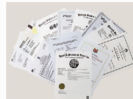
苏州稻香村获得部分国际商标注册证