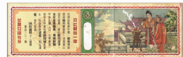
苏州稻香村老包装