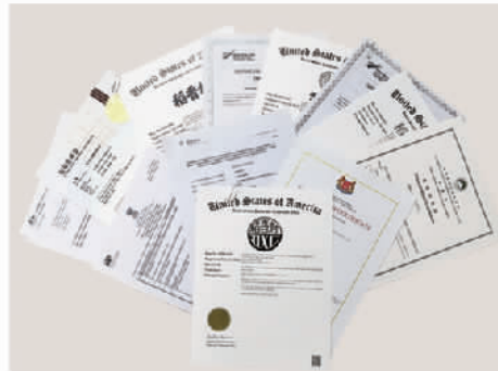
苏州稻香村获得部分国际商标注册证