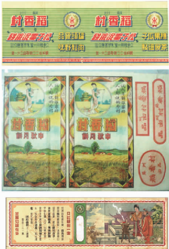
苏州稻香村老包装