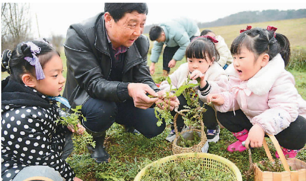
江苏省镇江市南山街道的志愿者带小朋友体验挖野菜，乐享春光。

环视一圈，家家院落都已显出春色。金針菜从焦黄欲燃的枯叶里冒出新芽，绣球的根部鼓起了米粒。枝头的杏花，正等待明朝春光。春色渐浓，我们呢，趁春风寻烟翠去。