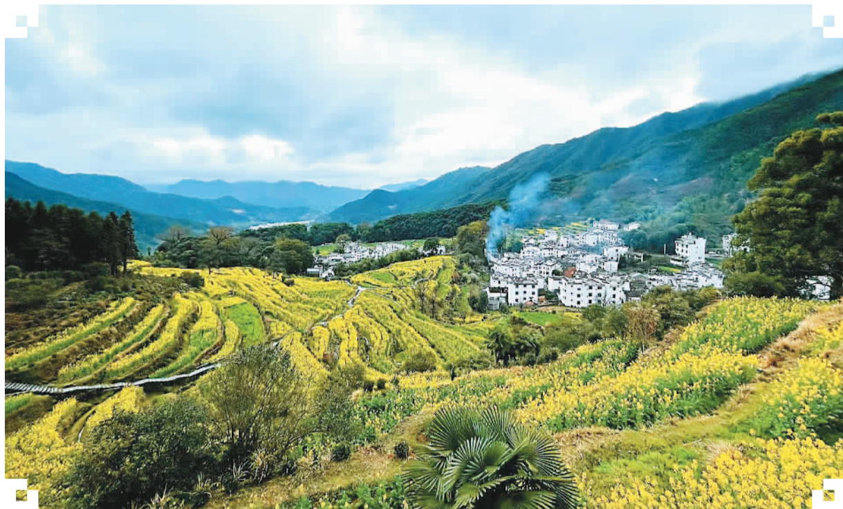
3月1日，江西婺源一年一度的赏花期已经到来，目前平原地区油菜花已开放80%，婺源江岭及篁岭油菜花花海预计将在1周内达到最佳赏花期。