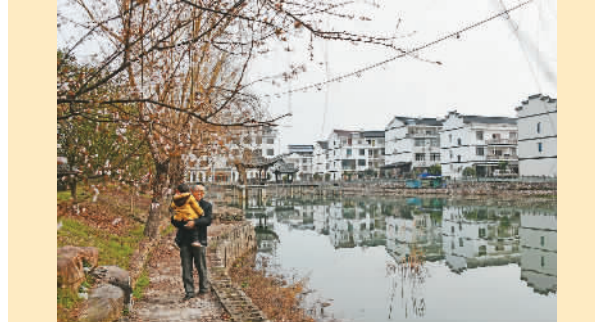
浙江省台州市仙居县通过“厕所革命”、河道综合整治等措施，促进乡村美丽蝶变，图为下各镇杨桥头村粉墙灰瓦的民居倒映在河水里。