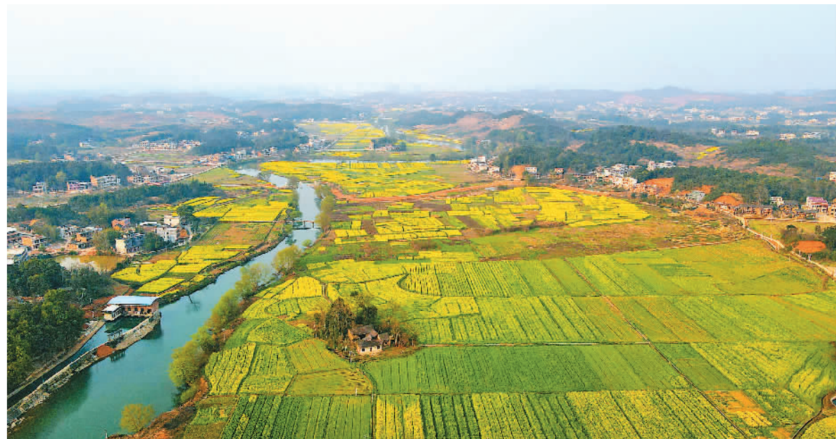
湖南省常德市胜桥镇宜水河两岸油菜花开与清澈的河水构成一幅美丽乡村画卷。