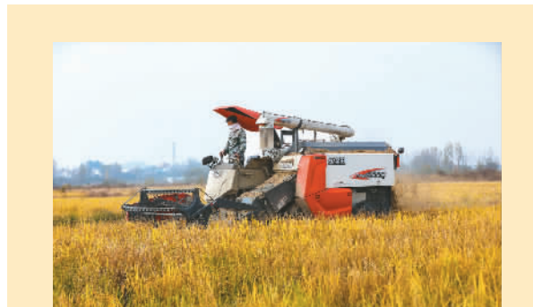
河南省信阳市光山县罗陈乡张楼村青龙河正合作社社员喜收第二茬再生水稻。

然而，我国污水资源化利用率却并不高。此次印发的意见明确，到2025年，全国污水收集效能显著提升，县城及城市污水处理能力基本满足当地经济社会发展需要，水环境敏感地区污水处理基本实现提标升级；工业用水重复利用、畜禽粪污和渔业养殖尾水资源化利用水平显著提升；污水资源化利用政策体系和市场机制基本建立。到2035年，形成系统、安全、环保、经济的污水资源化利用格局。